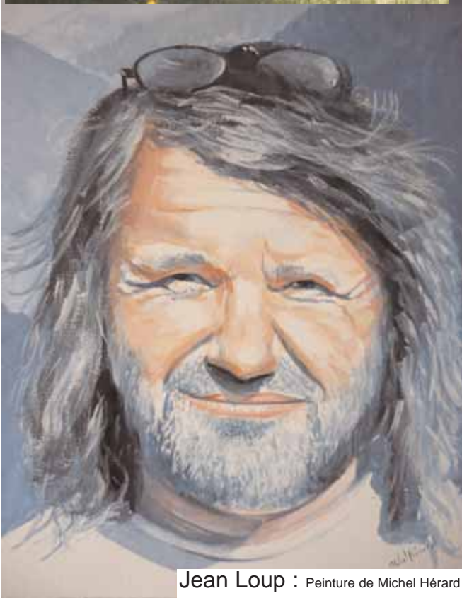
Jean Loup : Peinture de Michel Hérard